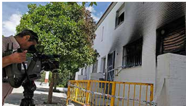
Un cámara grava el incendio que provocaron algunos vecinos de Estepa en una de las viviendas asaltadas

Tercero: Lo que sigue a continuación demuestra hasta que punto aquellos bárbaros no respetaron ni siquiera a la Guardia Civil. Sobre la una de la tarde, los imputados se trasladaron a otra calle de Estepa y, “a pesar de que la Guardia Civil en todo momento intentó que se calmaran y que desistieran de asaltar la casa, a pesar de que los insultaron y arrinconaron, los denunciados entraron también en el inmueble produciendo destrozos en muebles y enseres”. Pero, gracias a Dios, la familia gitana que la ocupaba, asustados y temiendo por sus vidas, salieron huyendo “porque saltaron al patio colindante”.