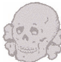
Emblema metálico de las gorras de las Waffen SS