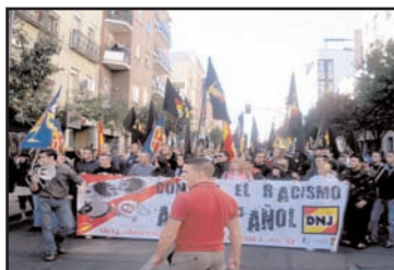
Usera (Madrid) 11.11.07