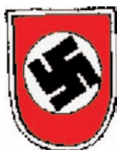
Emblema Izquierdo del casco de las Waffen SS