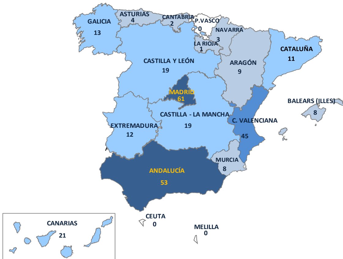
Gráfico 6.- Incidentes registrados en España durante 2013 por tipología penal de hechos cometidos contra discapacitados (Datos todos los cuerpos policiales, excluido Ertzaintza)

La localización territorial, nos permite ubicar a Madrid y Andalucía, como las zonas con mayor presencia de estos hechos.