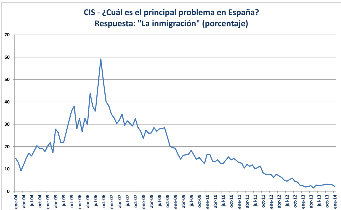
Gráfico 1.-Barómetro CIS sobre la considera como principal problema en España de la inmigración

La sensación subjetiva de carácter negativo de la ciudadanía sobre la inmigración, es un extremo importante, que salvo un pico elevado en el 2006, muestra valores a la baja. Este hecho se puede corroborar con los barómetros del CIS (Centro de Investigaciones Sociológicas)