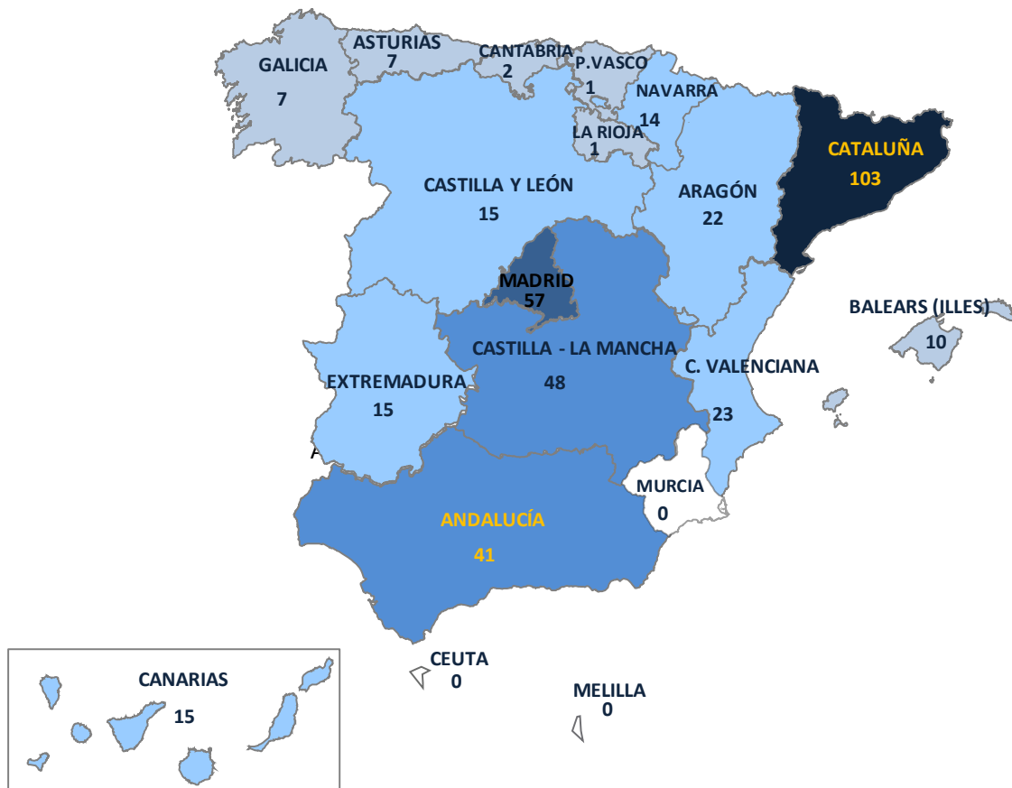
Gráfico 5.- Incidentes registrados en España durante 2013 por tipología penal de hechos cometidos con motivaciones racistas/xenófobas (Datos todos los cuerpos policiales, excluido Ertzaintza)

En territorios destaca Cataluña, Madrid, Castilla la Mancha y Andalucía