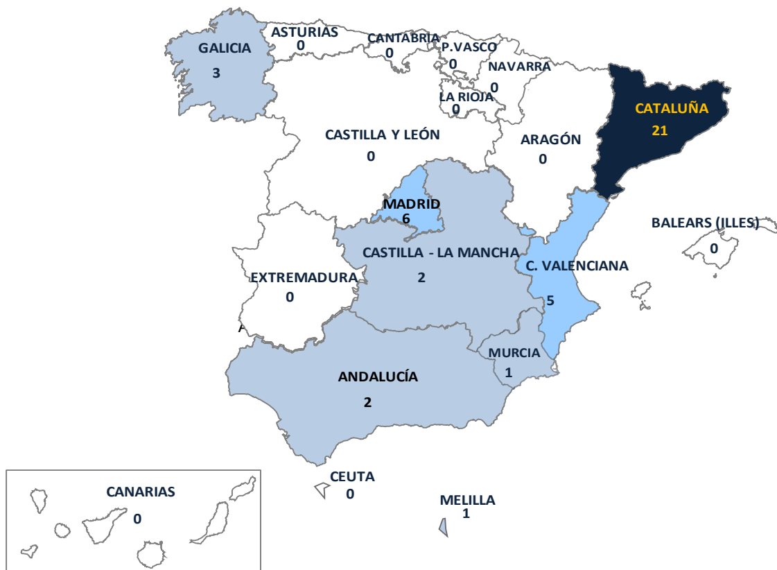
Gráfico 7.- Incidentes registrados en España durante 2013 por tipología penal de hechos cometidos por las creencias o prácticas religiosas de las víctimas (Datos todos los cuerpos policiales, excluido Ertzaintza)

Cataluña prevalece cuantitativamente sobre las demás comunidades autónomas, seguida de Madrid y la Comunitat Valenciana.