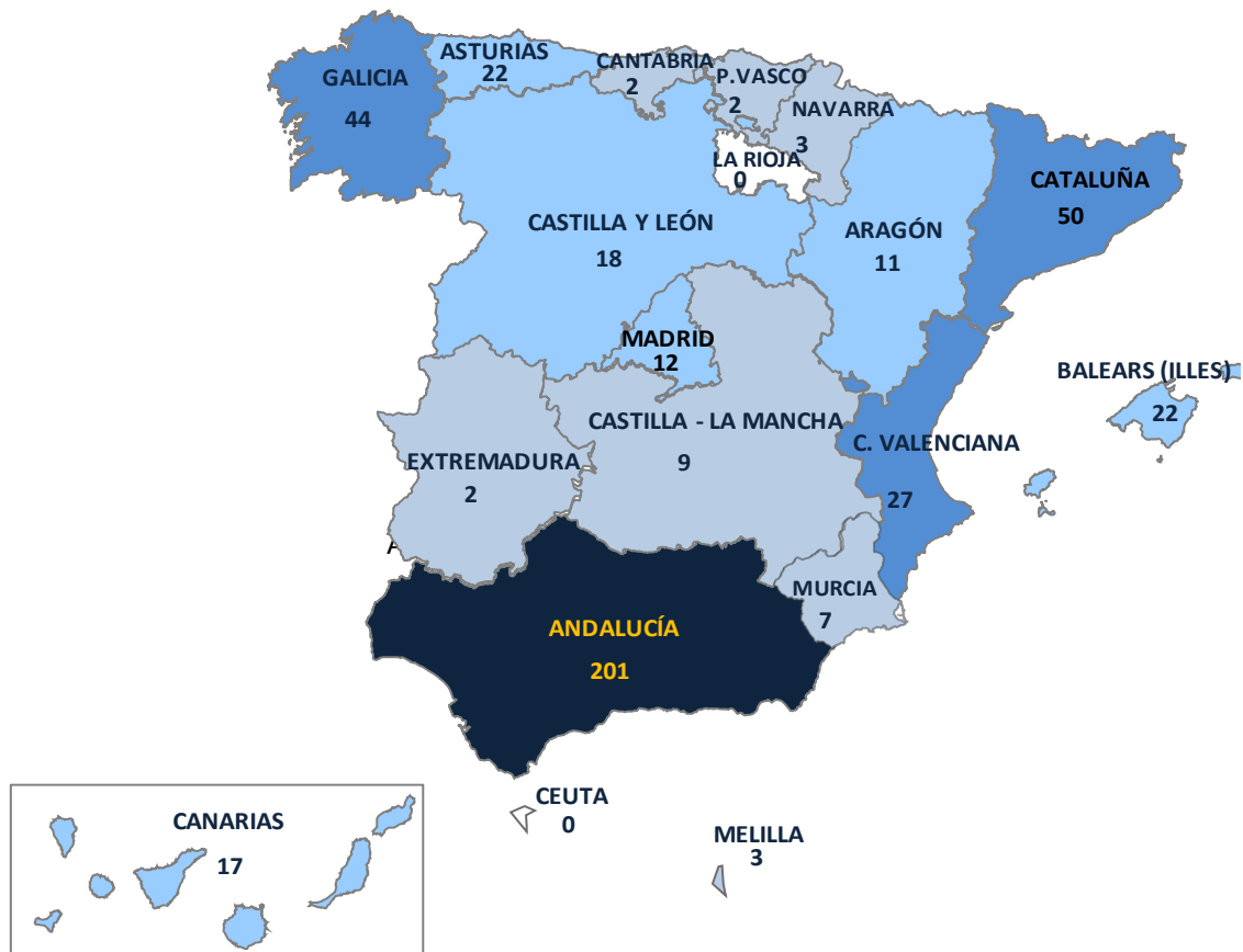
Gráfico 4.- Incidentes registrados en España durante 2013 por tipología penal de hechos cometidos por la orientación e identidad sexual de las víctimas (Datos todos los cuerpos policiales, excluido Ertzaintza)

Por territorios, el mayor volumen de hechos ocurre en ANDALUCÍA, seguido de CATALUÑA.