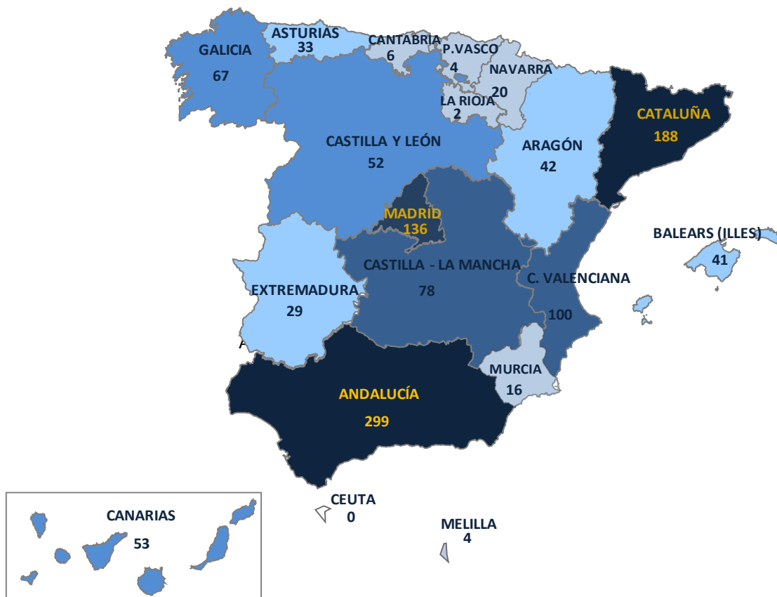
Gráfico 3.-Delitos de odio registrados en España durante 2013 (Datos todos los cuerpos policiales, excluido Ertzaintza)

Respecto a su distribución geográfica en el siguiente mapa se refleja la situación durante el año 2013.