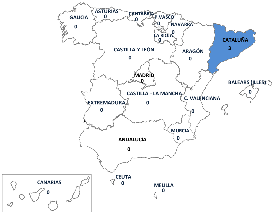
Gráfico 9.- Incidentes registrados en España durante 2013 por tipología penal de hechos con motivaciones antisemitas (Datos todos los cuerpos policiales, excluido Ertzaintza)

Todos los hechos por este apartado se han cometido exclusivamente en Cataluña.