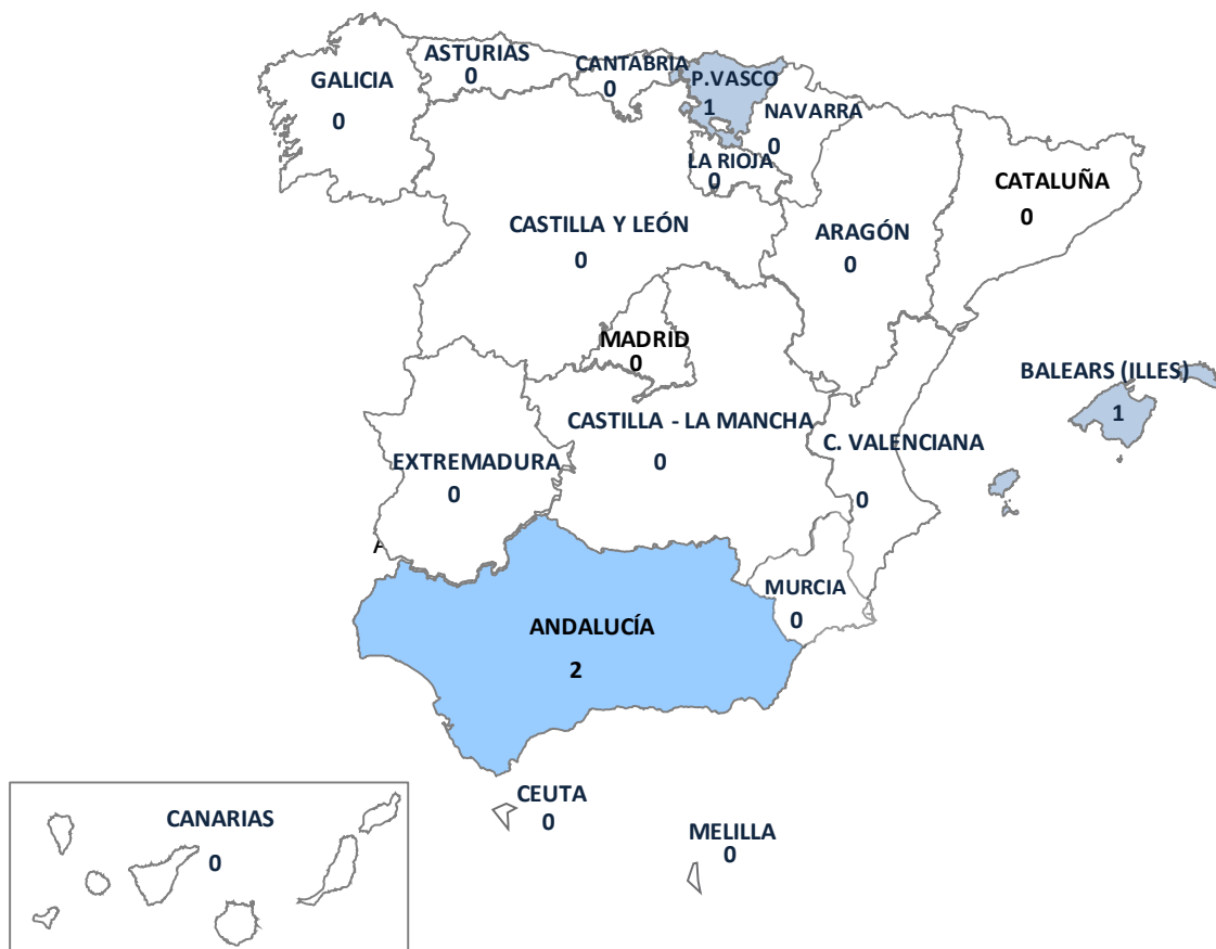
Gráfico 8.- Incidentes registrados en España durante 2013 por tipología penal de hechos cometidos por situación de pobreza de las víctimas (Datos todos los cuerpos policiales, excluido Ertzaintza)

Los lugares de comisión se ubican en Andalucía, País Vasco e Illes Balears.