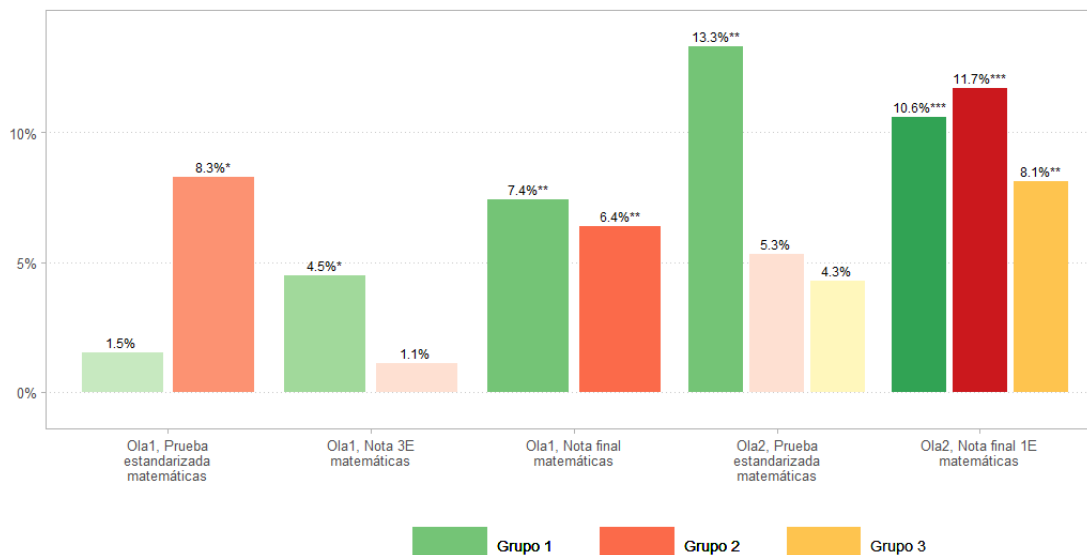
Figura 1. Resultados de la evaluación del proyecto "Refuerzo educativo para menores en situación de vulnerabilidad" de la Comunidad Foral de Navarra

Nota: La tonalidad de color muestra la significatividad de los indicadores (*, **, ***). A mayor significatividad, más oscuro.