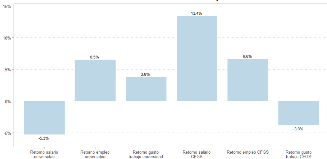
Figura 2. Resultados de la evaluación del programa "Hedera: transiciones a la educación superior"

Nota: La tonalidad de azul muestra la significatividad de los indicadores (*, **, ***). A mayor significatividad, más oscuro.