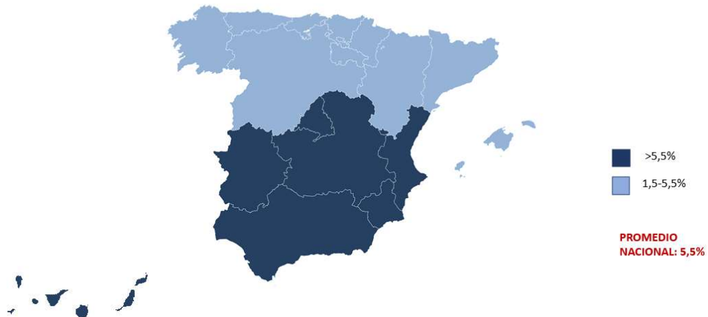
Crecimiento en el empleo (%) por comunidad autónoma Serie desestacionalizada. Variación entre febrero 2020 y febrero 23

Todas las comunidades autónomas registran niveles de empleo superiores a los que tenían antes de la pandemia. Destaca el aumento de la afiliación en la mitad sur del país y en los archipiélagos, con un incremento del empleo superior al 5,5%.