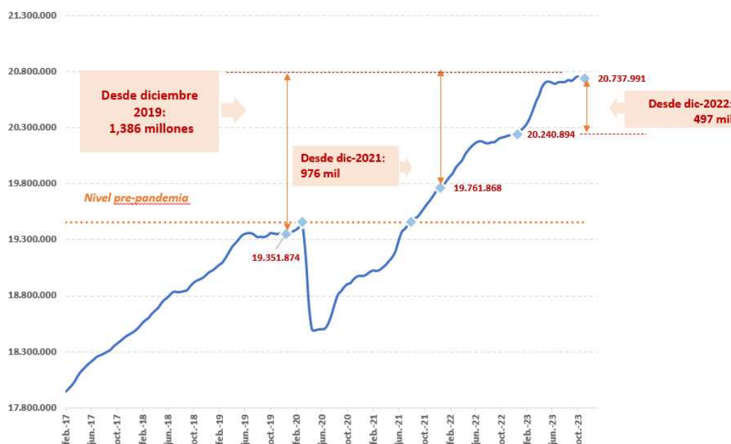
Afiliación ajustada de estacionalidad Serie desestacionalizada