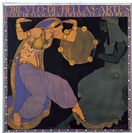
Cartel de Rafael Penagos de la colección Círculo de Bellas Artes.