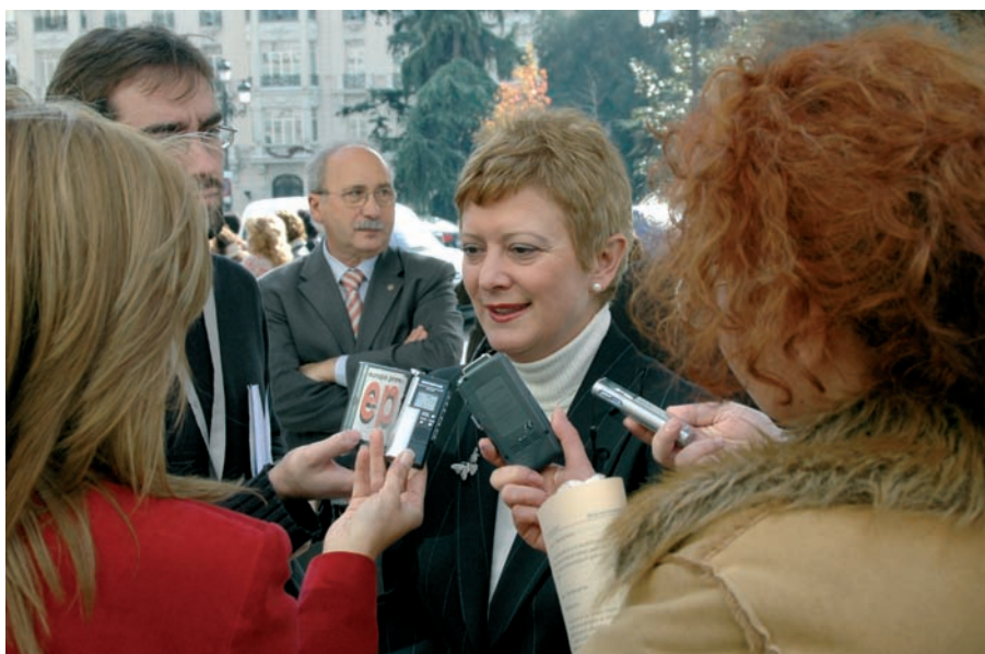
La secretaria de Estado, Consuelo Rumí, expresa su satisfacción a los medios tras la aprobación del Estatuto.

El Ministerio de Trabajo y Asuntos Sociales ya ha creado el Portal de la Ciudadanía Española en el Exterior como punto de información integral en Internet. Para mantener ac-