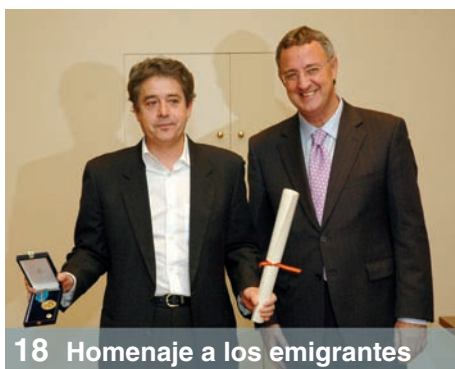
18 Homenaje a los emigrantes