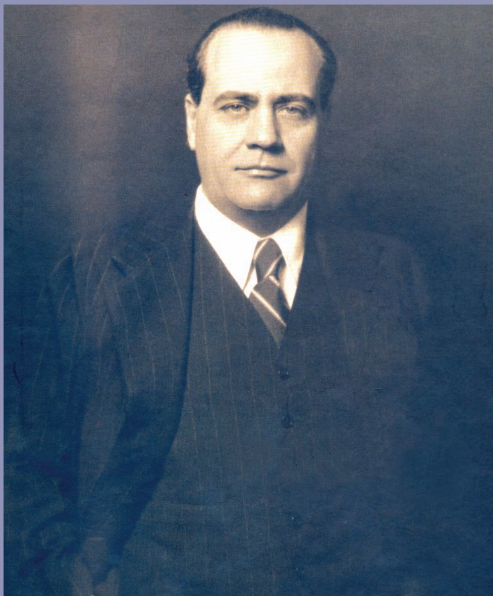
Juan Negrín retratado en Nueva York en los años cuarenta.

La exposición que ahora se celebra en el madrileño cuartel del Conde Duque, rememora la historia de este hombre de tranquila energía, un socialista peculiar obligado en circunstancias excepcionales a acercarse a las disciplinadas fuerzas comunistas, porque fueron ellas las únicas que compartieron su decisión de resistir al fascismo hasta el final. En aquellos días trágicos para España, la República había sido abandonada a su suerte por