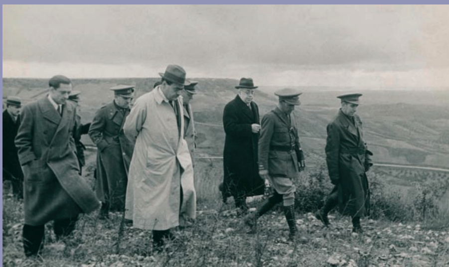
Juan Negrín junto a Manuel Azaña, visitando el frente del Centro. Noviembre de 1937.