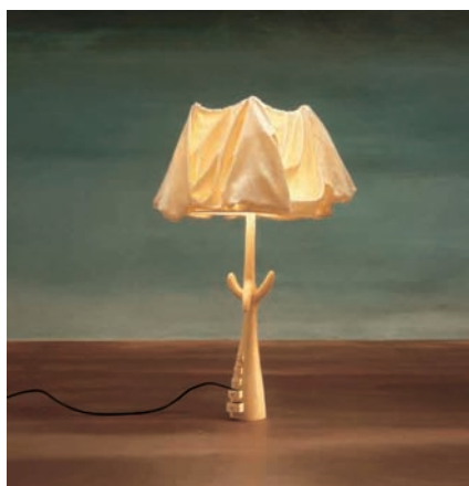
Calidez y confort son los rasgos distintivos en los objetivos luminarios.