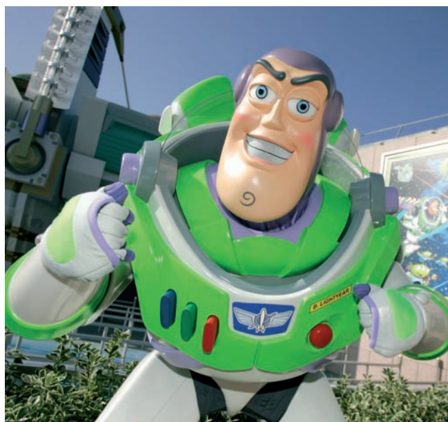
Buzz Lightyear, uno de los últimos ídolos disney.

contenta en el departamento en el que estoy, de atención al visitante. Pero tal vez me apetezca conocer otros departamentos y otras facetas. Puede ser en un hotel, en el departamento de traducciones. Hay varias posibilidades”, concluye.