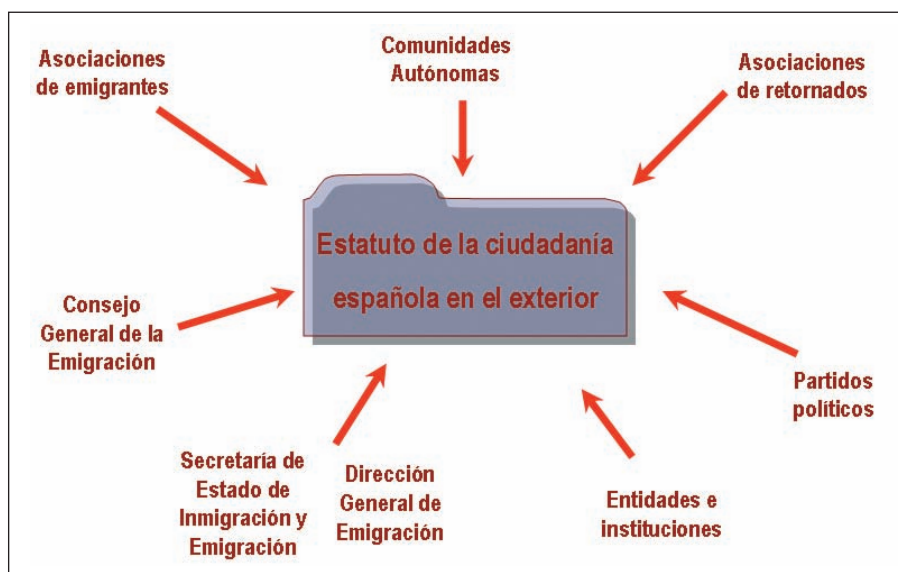
Las diversas entidades que han prestado su aportación al contenido del Estatuto.

tualizada esta información, las administraciones públicas coordinarán con el MTAS toda la información relevante en la materia.