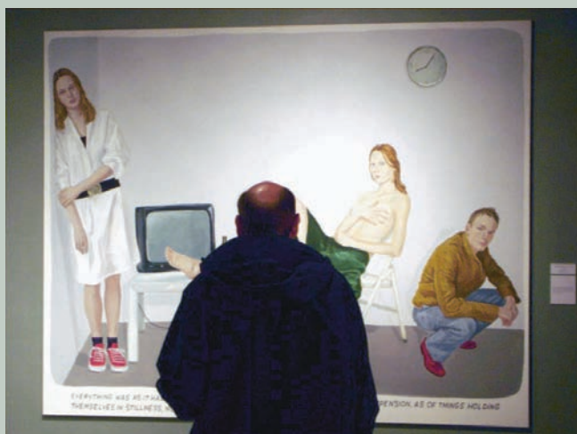
Muntean y Rosenblum. Sin título, la derecha un cuadro de la exposición en el MUSAC de León.