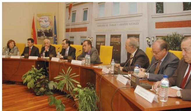
Mesa redonda sobre emigración.

lio político) a la que movió a los españoles a salir al exterior en busca de mejores oportunidades laborales y vitales. Esa especie de empatía cargada de solidaridad, se plasmó en la afirmación de varios de los consejeros de que “nosotros también emigrábamos sin papeles