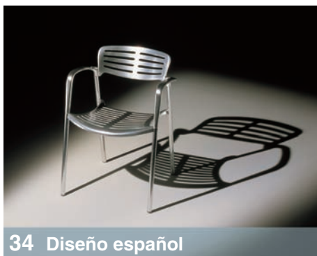
34 Diseño español