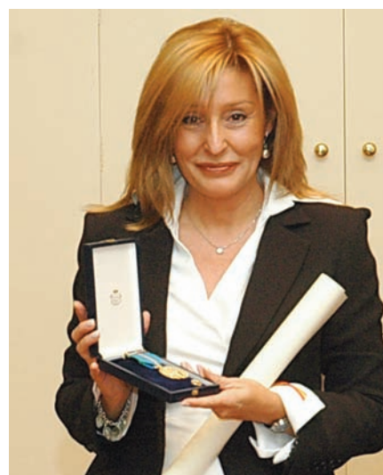
Chinny Gamir de La Región Internacional

abandonaron su tierra para abrirse un porvenir mejor, el que no podían encontrar en su propio país (...). Sin embargo, España no olvida ni al millón y medio de sus ciudadanos que siguen viviendo en el exterior ni a la trayectoria de tantos que les han antecedido