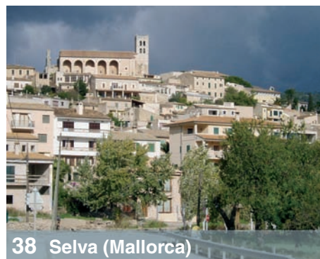
38 Selva (Mallorca)