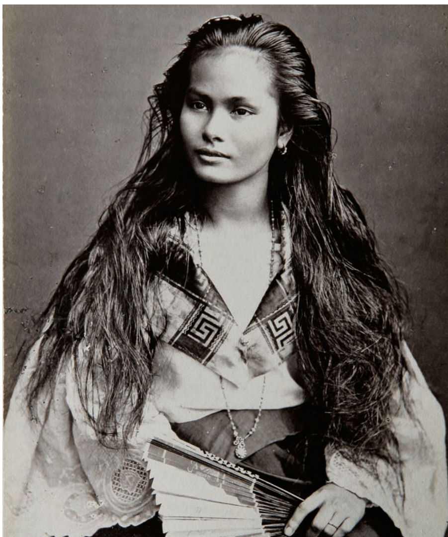
Mestiza sangley filipina. 1875.