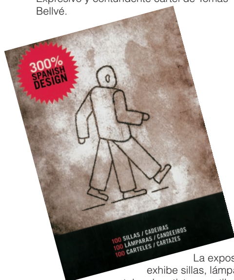
La exposición exhibe sillas, lámparas y carteles de artistas y estilos dispares.