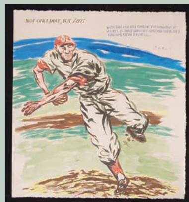
Raymond Pettibon: "Not only".

H an coincidido en España en estos meses dos exposiciones que abundan en la tendencia emergente del arte más o menos combativo, con mensaje, interesado en la plasmación y el análisis de la realidad. Markus Muntean y Adi Rosenblum trabajan juntos desde 1992. Sus obras se exponen por primera vez en España en el Museo de Arte Contemporáneo de León (MUSAC). Sus pinturas y dibujos son a menudo de gran tamaño y utilizan referentes como el tebeo y la imaginería religiosa, un estudiado hieratismo para tratar de transmitir una sensación de desorientación existencial y de crisis de identidad de jóvenes y adolescentes, que son siempre las figuras perdidas de sus obras. El Museo de Arte Contemporáneo de Málaga está exponiendo una abundante muestra de Raymond Pettibon. La obra de este estadounidense conecta directamente con la viñeta y es deudora del gran cómic americano, el cómic underground de los Crumb, Shelton y compañía y con la iconografía popular, deportiva y costumbrista yanqui. Dos excelentes muestras en dos ciudades fuera del circuito artístico habitual.