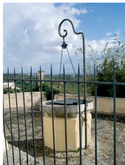
El pozo, remachado y encerrado, adorna un pequeño jardín.