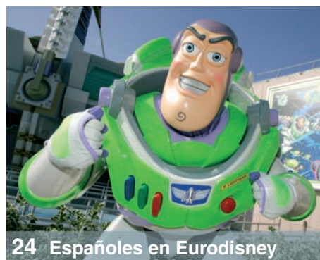
24 Españoles en Eurodisney