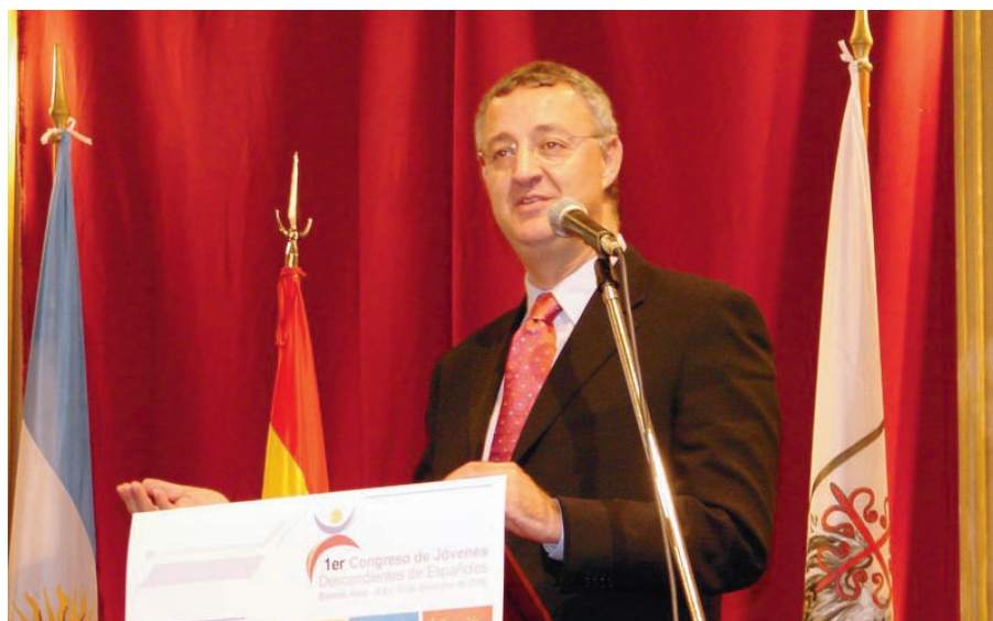
Jesús Caldera, clausurando el Congreso de Jóvenes Descendientes.

El acto de clausura del 1º Congreso de Jóvenes Descendientes de Españoles contó con la presencia del ministro de Trabajo y de Asuntos Sociales Jesús Caldera. Además, estuvieron presentes el ministro de Salud de Argentina Ginés González García y el jefe de Gobierno de la Ciudad de Buenos Aires, Jorge Telerman.