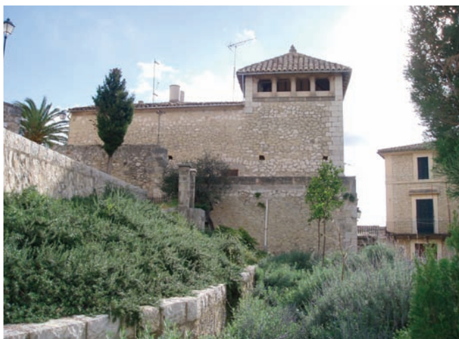
La casa fortaleza es un recuerdo de la nobleza medieval.