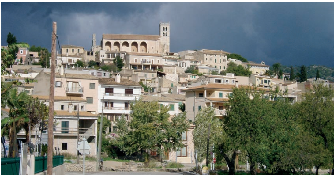
Llegando desde Palma se contempla esta vista panorámica de Selva, con la Iglesia dominando sobre el pueblo.

Cercana a Inca, a 45 minutos de Palma y a escasos kilómetros de algunas de las mejores playas de la isla, como Es Trenc o Sa Rápita, en la historia de Selva también encontramos momentos