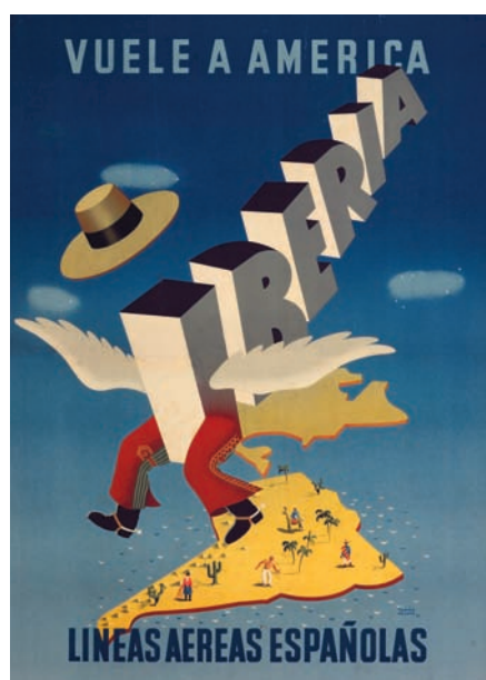
Expresivo y contundente cartel de Tomás Bellvé.