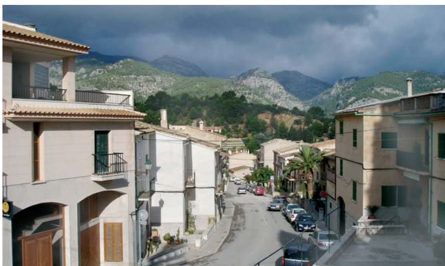
Casi desde cualquier punto del punto se contempla el espectáculo de la Sierra de Tramuntana.