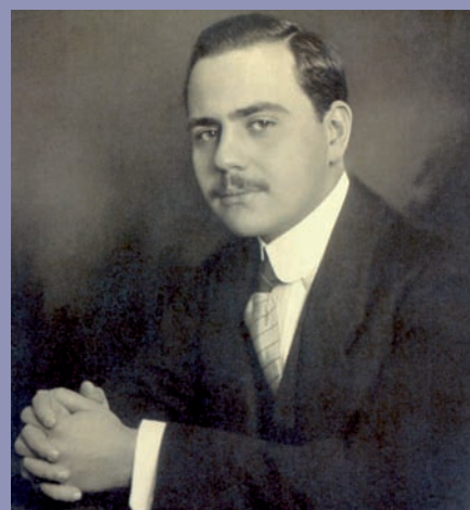
Negrín durante sus años de estudio en Alemania.