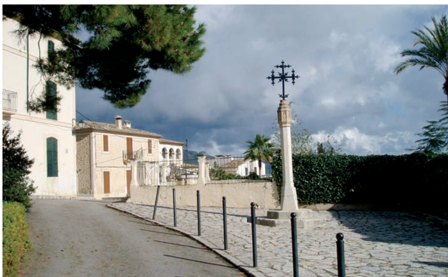
El crucero marca en la actualidad el fin de la zona peatonal.