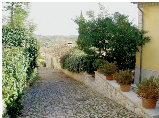
El casco antiguo, mimado y bien conservado.