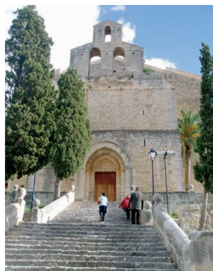
Una fatigosa escalinata conduce hasta la Iglesia.