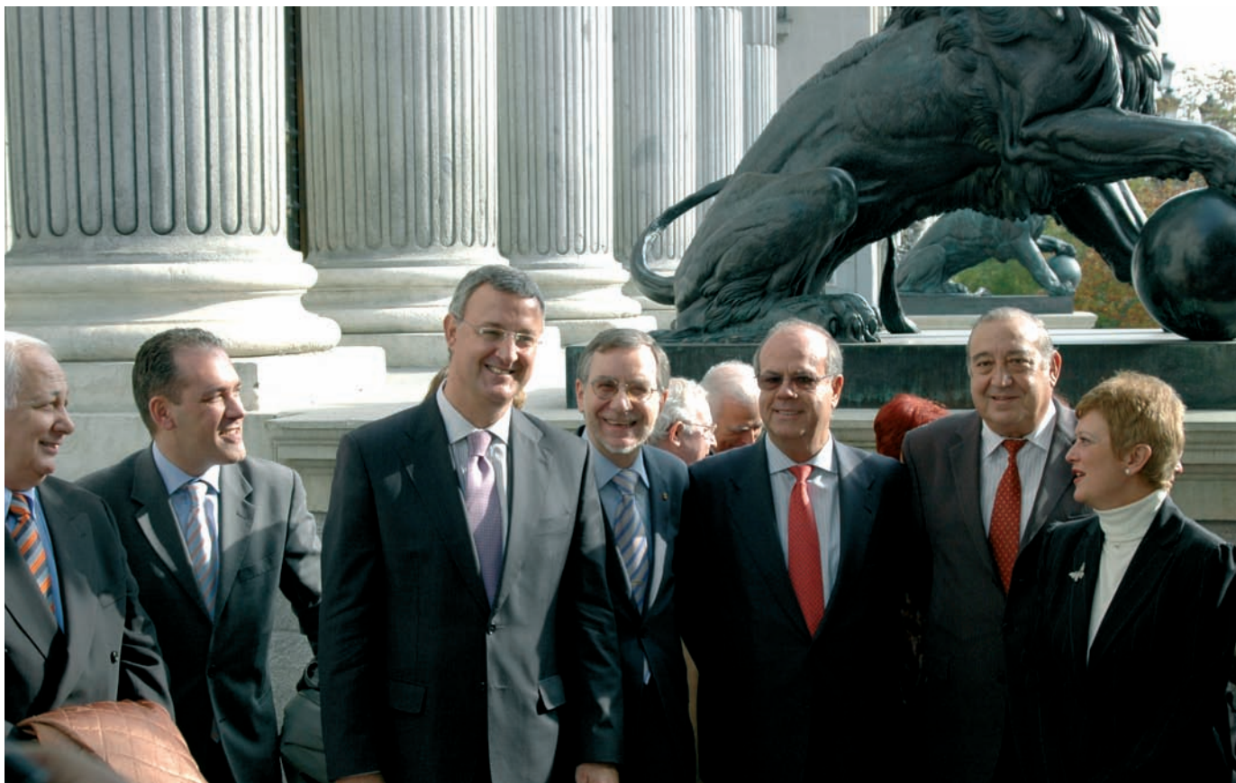
El ministro Jesús Caldera y la secretaria de Estado, Consuelo Rumí, en las puertas del Congreso tras la aprobación del Estatuto.