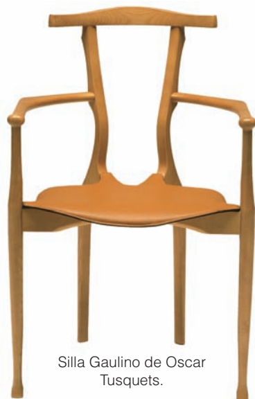
Silla Gaulino de Oscar Tusquets.