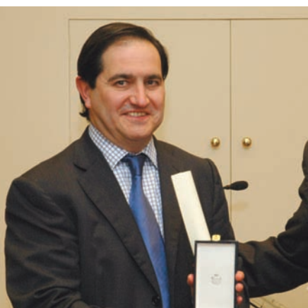
Javier Arenas, director de Radio Nacional de España.