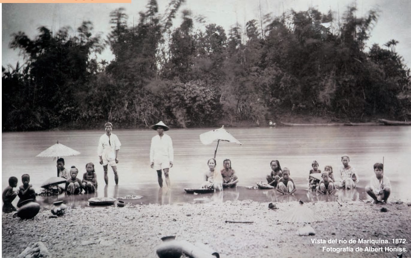
Vista del río de Mariquina. 1872.