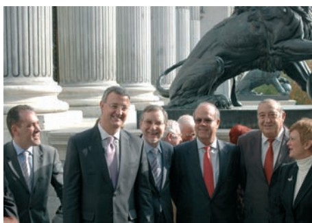
8 Entra en vigor el Estatuto

Carta de España autoriza la reproducción de sus contenidos siempre que se cite la procedencia. No se devolverán originales no solicitados ni se mantendrá correspondencia sobre los mismos. Las colaboraciones firmadas expresan la opinión de sus autores y no suponen una identidad de criterios con los mantenidos por la revista.