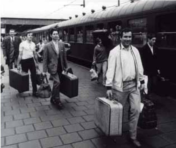
Llegada de trabajadores españoles a la estación de Eindhoven.