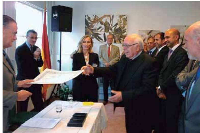
El embajador Javier Vallaure entrega uno de los diplomas.

te, que más tarde recorrerá Holanda y podrá verse en el museo 'Twentse Welle' de Enschede; en la Biblioteca Pública de Rotterdam, y en el Museo Histórico Regional de Eindhoven. Posteriormente hará un itinerario por diferentes Comunidades Autónomas, en España, y tratará, en definitiva, de que los ciudadanos españoles conozcan mejor las historias de sus propios emigrantes para comprender los movimientos migratorios de hoy en día