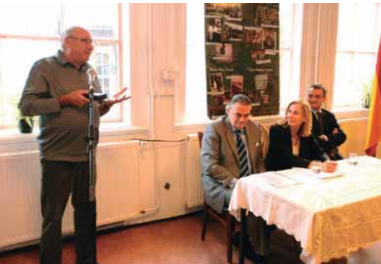
Uno de los galardonados agradece la distinción.

El movimiento asociativo de los emigrantes españoles en los Países Bajos