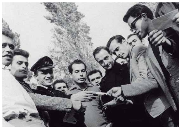
Obreros españoles recibiendo el correo.

de lengua y cultura española en los Países Bajos.