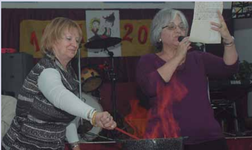
Al fin de la jornada “queimada” y “conxuro”.