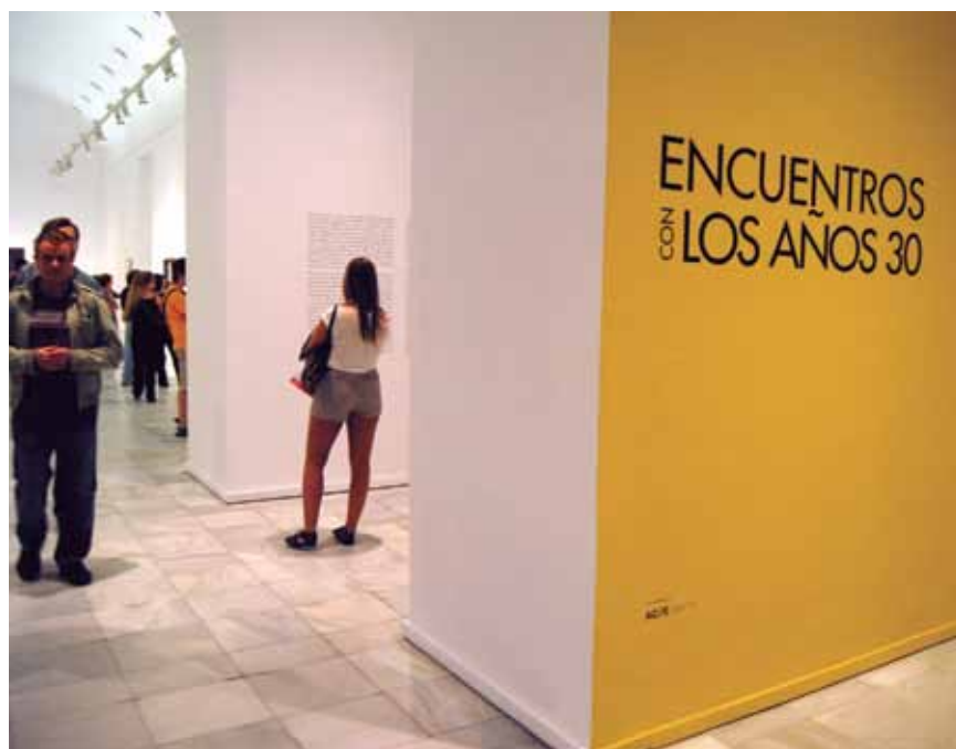
Los dos espacios de la exposición, en dos plantas, con un total de dos mil metros cuadrados, han sido permanentemente visitados.