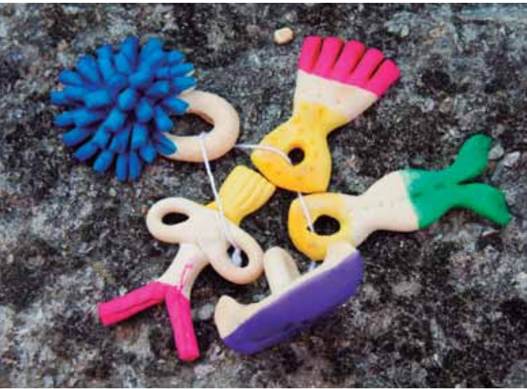
Los "sanandresiños" son exvotos que los peregrinos adquieren a la puertas del monasterio.