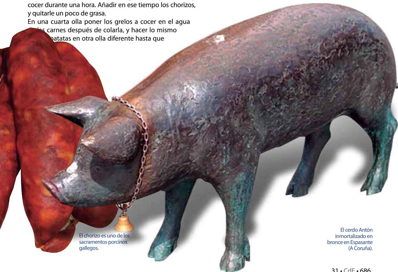
El chorizo es uno de los sacramentos porcinos gallegos.