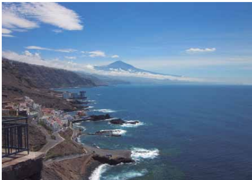
Costa de Tacoronte con el Teide al fondo.

Soy ciudadana española por recuperación, gracias a la oportunidad que le han dado a los descendientes. Tengo tres hijos, uno vive en Errenteria (Guipuzcoa) en el País Vasco,