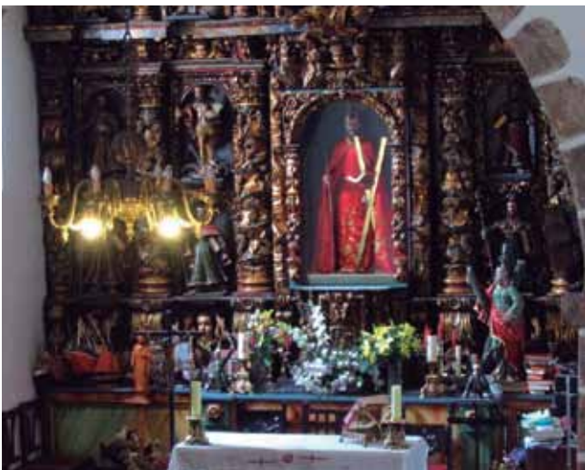
Los peregrinos, animados por la leyenda, acuden por miles todos los años.