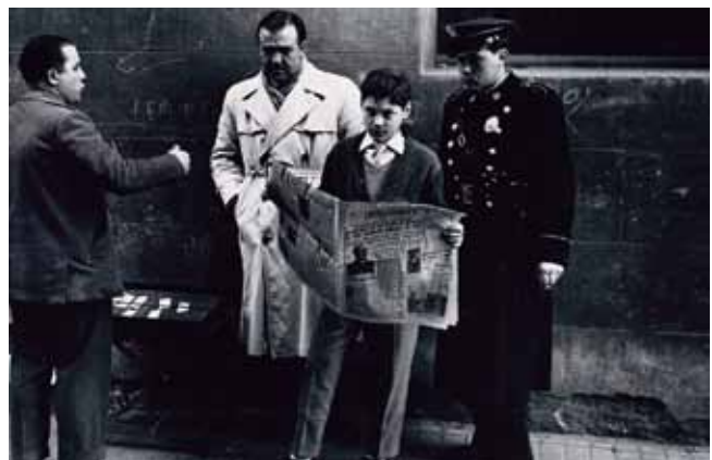
"Solidaridad Nacional" 1957