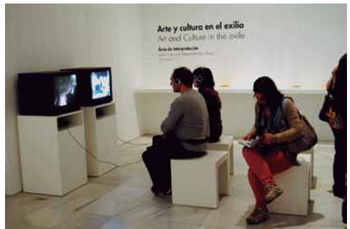
Los murales tienen dimensiones colosales. A la derecha, una de las salas donde se interpretaba el Arte y la cultura en el exilio.

la realidad oculta, se presenta a partir de las exposiciones internacionales en las que se mezclaron artistas como Miró, Arp o Ernst. Hay obras de Óscar Domínguez, André Breton, Roland Penrose, René Magritte, Matta, Dalí... André Breton quiso ser la ortodoxia del movimiento, que tuvo su reconocimiento tras las exposiciones que se presentaron en Nueva York, en la Julien Levy Gallery y en el MOMA. El proceso culminó con el "sueño erótico" del Pabellón de Venus, que ideó Salvador Dalí para la Feria Mundial de Nueva York (1939).