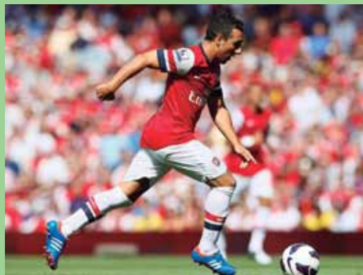
Santi Cazorla, nuevo jugador del Arsenal.