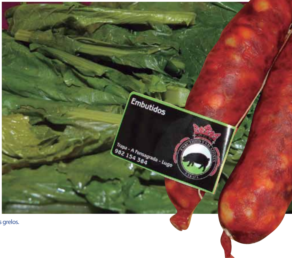
Sobre estas líneas cocido de Lalín y los omnipresentes grelos.