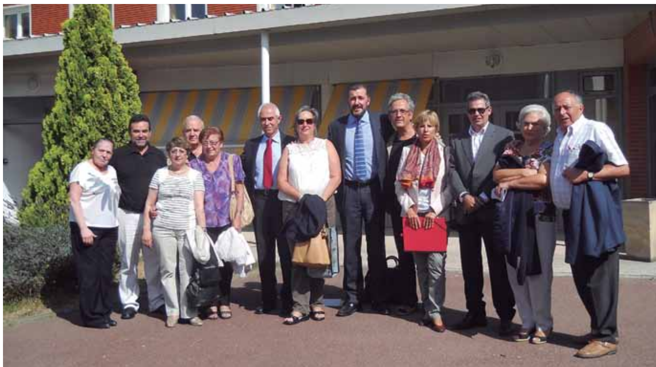
El director general con directivos del Centro de los Españoles de la Región de París, en la puerta del centro de La Plaine-Saint Denis.

El director general de Emigración sigue tomando contacto con los residentes españoles por el mundo