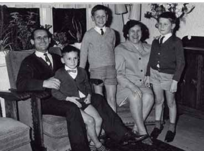
Familia española en Holanda a mediados de los sesenta.