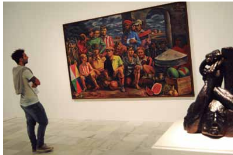
Maqueta del pabellón español en la Feria Internacional de París, de 1937; y el cuadro "New Chicahgo Athletic Club", que se exhibe por primera vez en España.