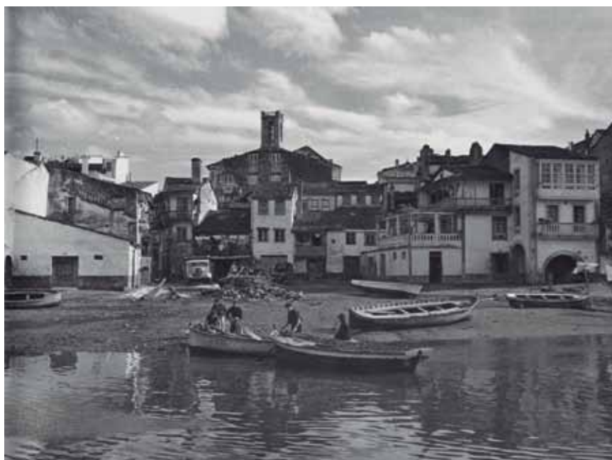
Betanzos en los años 50 y Ana González, primera esposa.

torno a esa época se empiezan a constituir en Cuba las sociedades «Hijos de...» referidas a ciudades y pueblos de Galicia. Este tipo de asociacionismo constituía un sistema de amparo físico y emocional de incalculable valor para los gallegos procedentes de cada localidad en concreto. El poder ser acogido por personas de tu propio pueblo, en muchos casos ya conocidas, mitigaba el brusco desarraigo que todos experimentamos al incorporarnos a la vida en un país extranjero; la soledad y año-