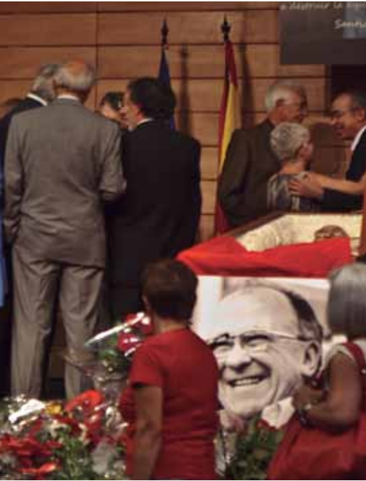
...dieron su adiós al líder comunista