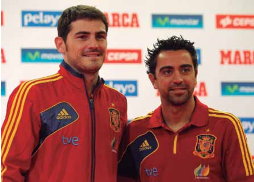
Iker Casillas y Xavi Hernández, premio Príncipe de Asturias.

sobre el fútbol ya que su deportista preferido es el “niño Torres”. Sin más queda de ustedes respetuosamente un fiel lectora.