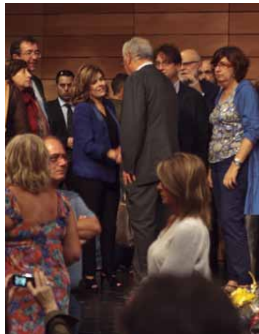
Los políticos más relevantes de la Transición y de nuestros días.

L a biografía de Santiago Carrillo abarca prácticamente todo el siglo XX, siendo testigo y actor de grandes acontecimientos de la historia de España: militante socialista en su juventud, participó en la revolución de Asturias de 1934; sufrió un largo exilio, en el que fue secretario general del PCE (1960-1982); evolución hacia el "eurocomunismo"; fue uno de los protagonistas de la Transición... en 1985 fue excluido del PCE.