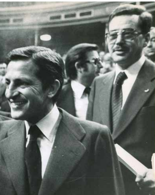
...se saludan en el Congreso de los diputados.

dieron mayor libertad de opinión y un congreso "democrático", fueron expulsados bajo la acusación de "fraccionalismo". Junto a otros comunistas europeos, con Enrico Berlinguer a la cabeza, formuló una versión más suave del comunismo: el "eurocomunismo".