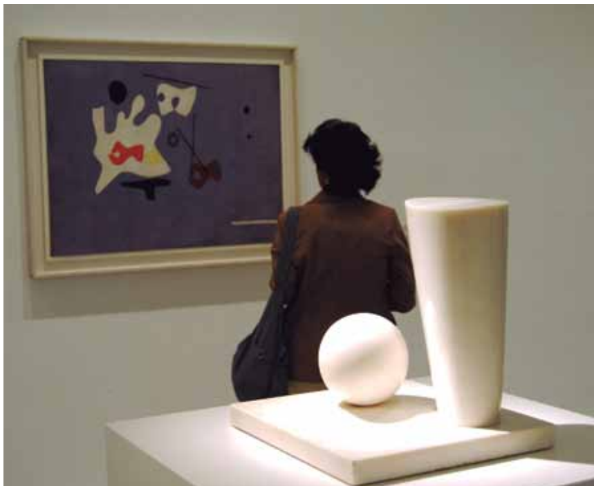
Pintura y escultura se complementan en sus distintas dimensiones: plano y tridimensional.

o Joaquín Torres García. En el trayecto se unieron Paul Klee, Baumeister, Kandinsky, Calder, Mondrian... Todos ofrecen sus peculiares facetas de la realidad, amable o desagradable. En el apartado sobre los proyectos nacionales e internacionales, se ofrecen los escenarios donde los artistas reforzaban los proyectos culturales de los gobiernos, enfrentados por su concepción del mundo. Tuvieron especial transcendencia la Exposición colonial de París (1931), la Mostra fascista (Italia 1933), la Exposición Internacional de París (1937), donde se expuso por vez primera el Gernika, de Picasso o la Feria Mundial de Nueva York (1939). Los artistas representaban la imagen de sus gobiernos a partir de obras que debían sintetizar los conceptos más avanzados del arte de vanguardia. El "Surrealismo", dentro de su esfera de creación al margen de la realidad o bajo