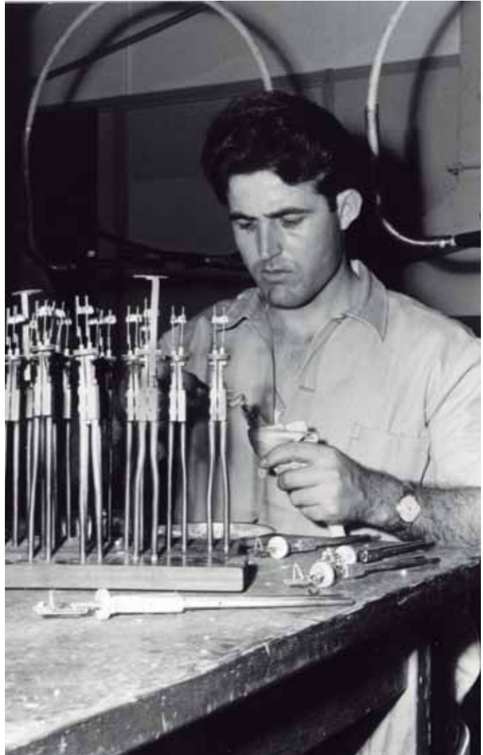
Obrero español en la fábrica de televisores Philips de Eindhoven.

punto de reunión y encuentro en el que los ciudadanos españoles, que vinieron a Holanda como emigrantes en los años 60 y posteriores, pudieran relacionarse en su propia lengua y cultura. Nacido como "Sociedad Española de Enschede" pronto adquirió en propiedad una sede social en un edificio independiente de dos plantas, con sala de reunión, biblioteca, bar social y otras dependencias que mantiene en perfectas condiciones de uso y que es una referencia para toda la colonia española de la localidad. En los primeros años de su actividad se caracterizó por la solidaridad entre sus miembros en la búsqueda de empleo, la adaptación al país, la traducción de correspondencia y escritos con empre-