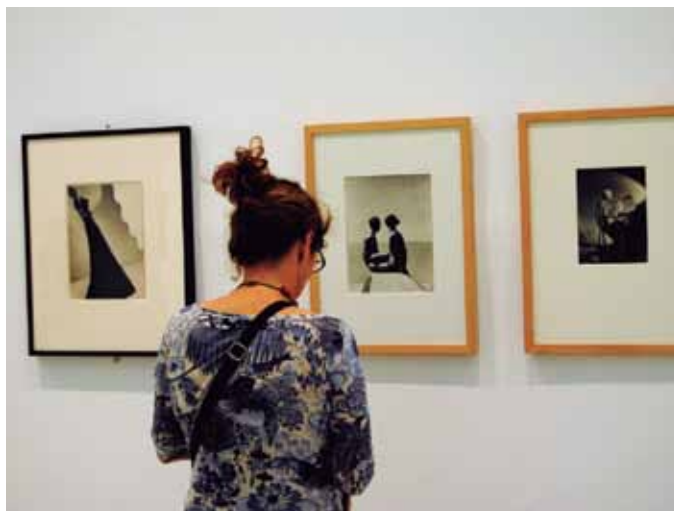
La Feria mundial de Nueva York, de 1939, fue todo un acontecimiento. A la derecha, fotos originales de los mejores autores de la época.