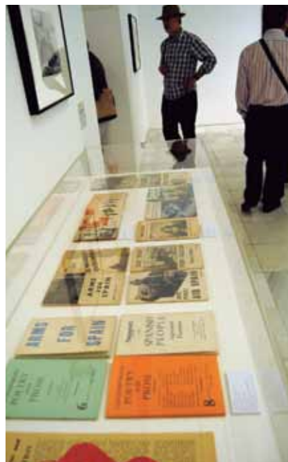
Todas las publicaciones del mundo se ocuparon de la guerra civil española.

El cine y la fotografía se incorporaron en los Años 30 como corriente de la cultura de masas: revolucionaría la cultura con imágenes fieles de la realidad (fotografía) o en movimiento (cine). Los fotógrafos dejan de ser aficionados para hacer Arte, propias de creadores. Los nombres más representativos