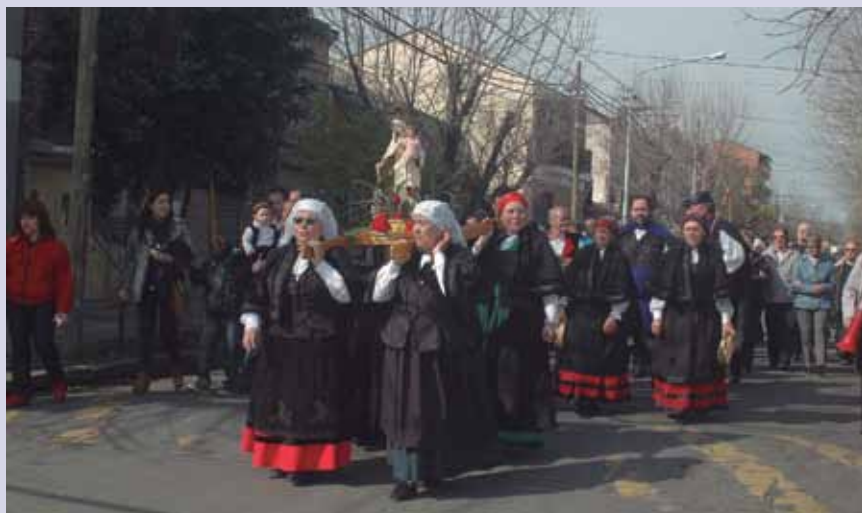
Procesión de la Virgen del Carmen en Buenos Aires.

El nombre Carmen procede de “Carmelo”, un monte situado en un pequeño pueblo de Israel, en-