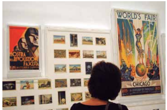
Las vanguardias nunca dejaron indiferente a nadie, ni en los años 30 ni en la actualidad. A la derecha, carteles de las distintas ferias internacionales.