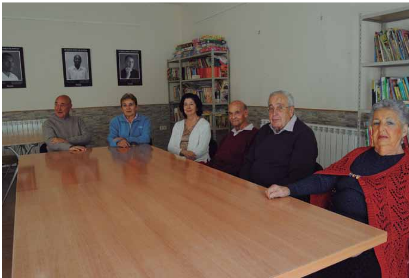
El grupo de seis retornados que permanecen temporalmente en Sigüenza.

Tras más de media vida en distintos países del extranjero, seis españoles han cumplido el sueño de retornar a su país, que un día dejaron por razones políticas o en busca de nuevos horizontes. Viven temporalmente en el centro ACCEM de Sigüenza (Guadalajara)