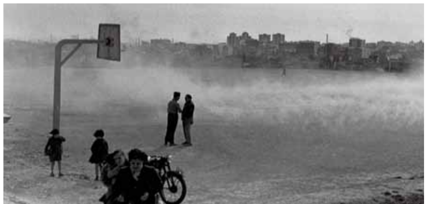
"Sant Andreu" 1959