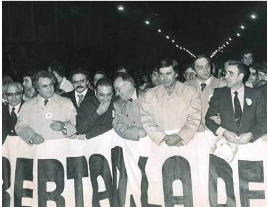
Todos los políticos y representantes sindicales, junto al pueblo, se manifestaron contra el golpe de Estado del esperpéntico Tejero.