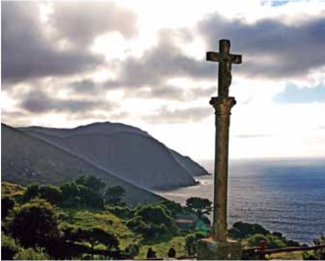
El pequeño santuario se erige a 140 metros sobre el Atlántico.