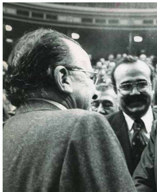
Santiago Carrillo con Adolfo Suárez, artífice de la transición.