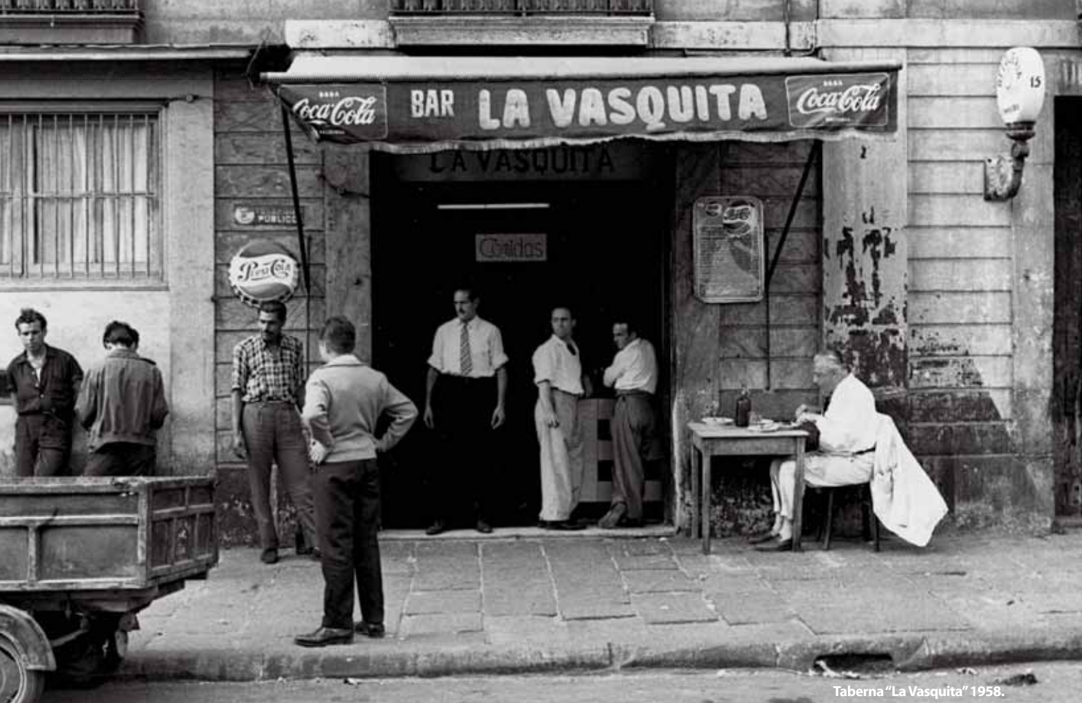
Taberna "La Vasquita" 1958.