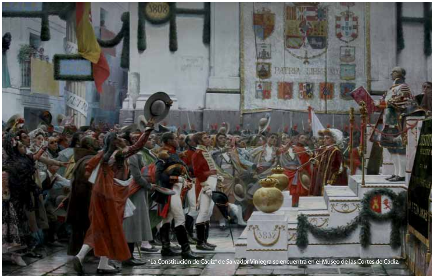
"La Constitución de Cádiz" de Salvador Viniegra se encuentra en el Museo de las Cortes de Cádiz.