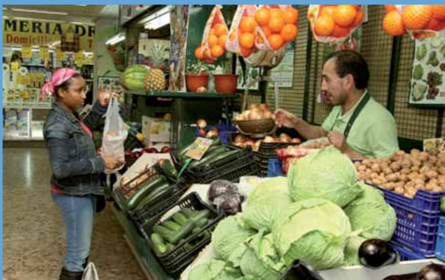
Este mercado es el ideal par obtener productos exóticos y raros en las tiendas habituales.