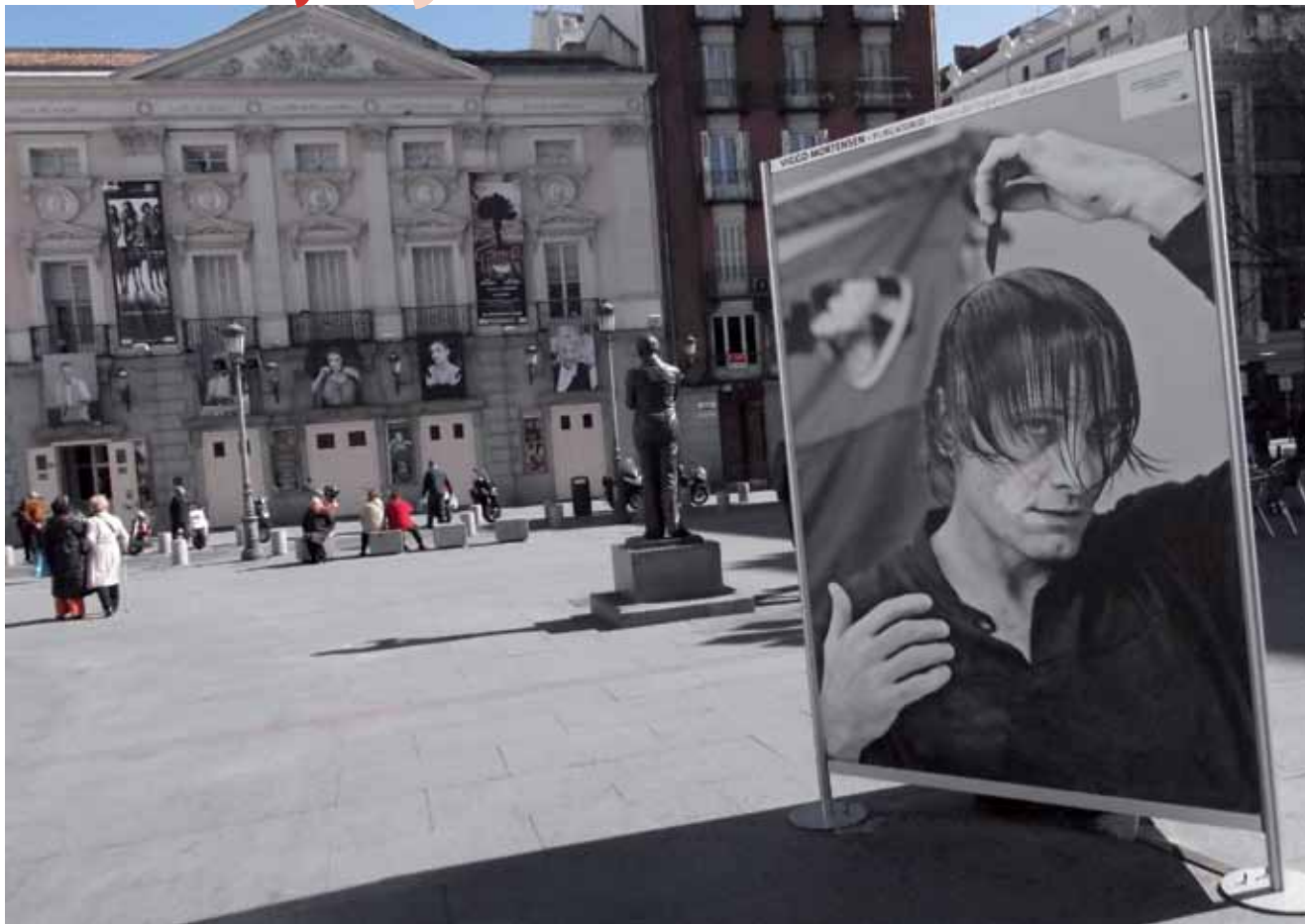
Retrato de Viggo Mortensen con el Teatro Español al fondo.