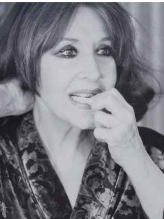
Concha Velasco preparándose.