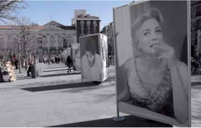
A la izquierda, Marisa Paredes. A la derecha, Ethan Hawke.