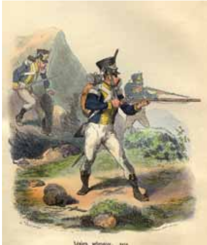
Soldados napoleónicos y a la derecha las gentes de Cádiz celebrando el bicentenario.