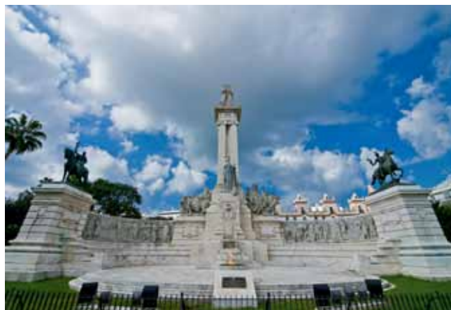
El Monumento a la Constitución en Cádiz.