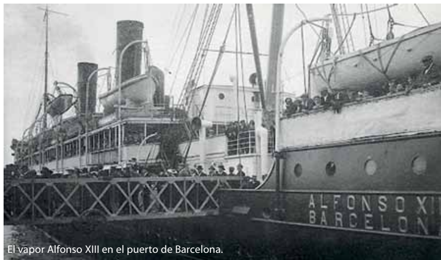
El vapor Alfonso XIII en el puerto de Barcelona.