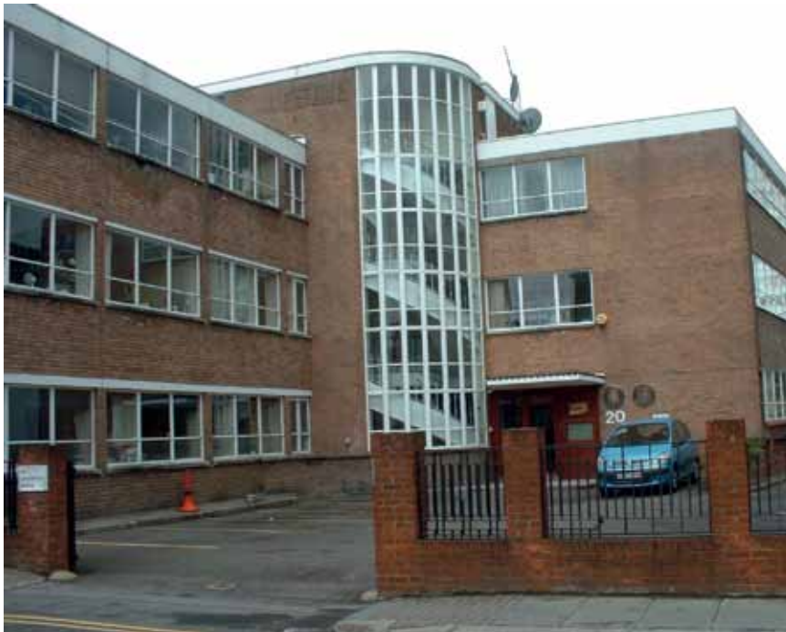
Edificio de la Consejería de Empleo y Seguridad Social en Peel Street, Londres.

Los paneles informativos de distintas organizaciones se explicarían directamente a los jóvenes, con los perfiles profesionales que buscan las empresas y cómo adquirirlos. De esta manera, los jóvenes entrarían