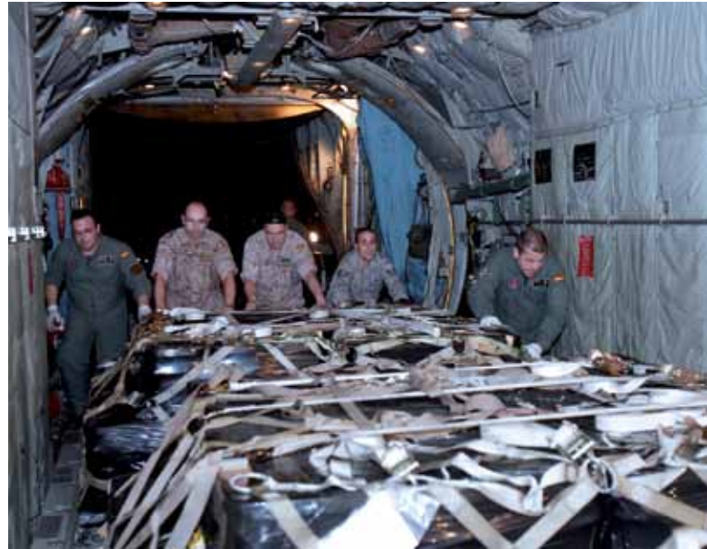
A la izquierda el Odyssey Explorer. Derecha militares españoles asegurando la carga de monedas.

Junta de Andalucía, la competente en esas aguas territoriales, se había opuesto alegando que la compañía no seguía los protocolos arqueológicos marcados por la Junta.