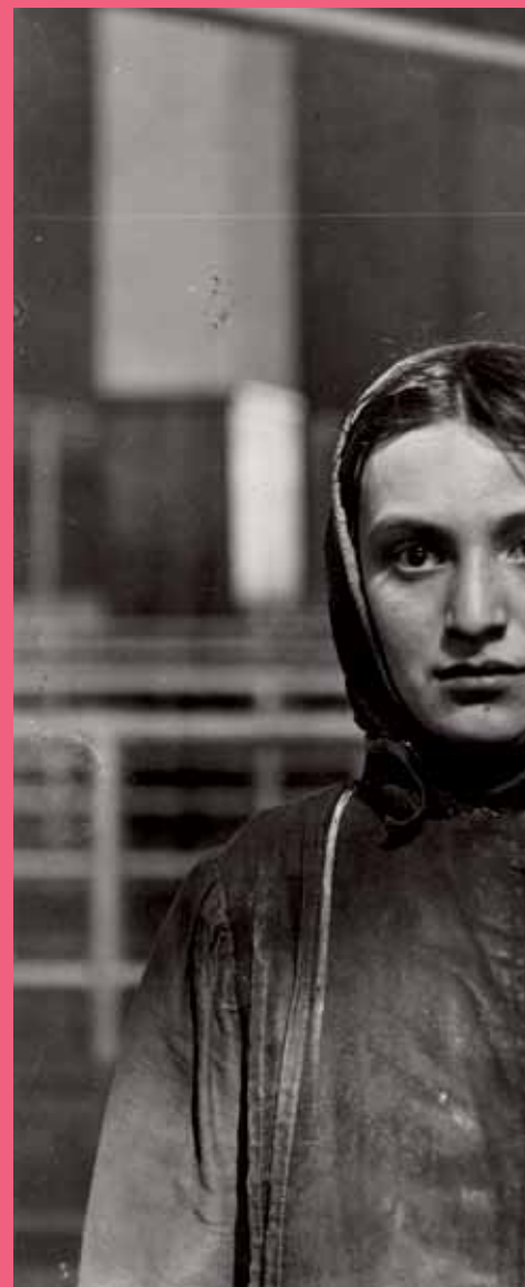
Mujer judía en la isla de Ellis. 1905

L a Fundación Mapfre ha recopilado una muestra notable de su vastísima obra y la expone en Madrid, después la exposición viajará a Rotterdam. La exposición plasma, mediante 170 imágenes, un completo recorrido por su trayectoria fotográfica, y sitúan la obra de Hine en el contexto artístico, político y cultural de su tiempo, desde sus primeros retratos de inmigrantes desembarcando en Ellis Island (Nueva York) y niños trabajadores, hasta su labor en Europa para la Cruz Roja americana a finales de la Primera Guerra Mundial. Lewis Wickes Hine nació en 1874 en Oshkosh (Wisconsin). En 1898 se matriculó en la universidad de Chicago, donde conoció a activistas de los movimientos reformistas sociales, por entonces en pleno auge por todo el país. De regreso a su pueblo natal se dedicó a la educación. En 1904 cae en sus manos su primera cámara fotográfica con el objeto de docu-