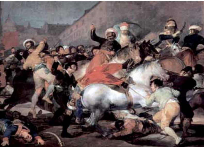
“La carga de los mamelucos” de Goya.