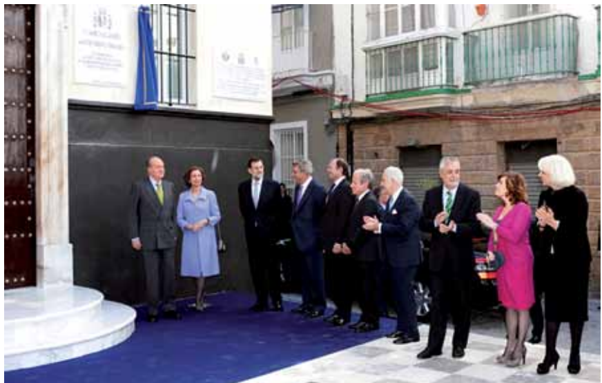
Acto institucional con las primeras magistraturas de la nación.

la Constitución de 1837. Sin embargo, apenas si entró en vigor de facto: en su período de gestación y elaboración, buena parte de España se encontraba en poder del gobierno de José Bonaparte I de España, hermano de Napoleón, monarca francés impuesto; el resto del país, estaba en mano de Juntas interinas, más preocupadas en organizar su oposición a José Bonaparte I. En los virreinos, territorios de la corona española, campaba la confusión y vacío de poder, productos de la invasión napoleónica.