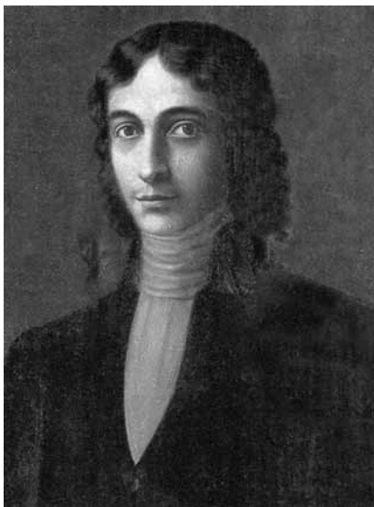
José Mejía Lequerica