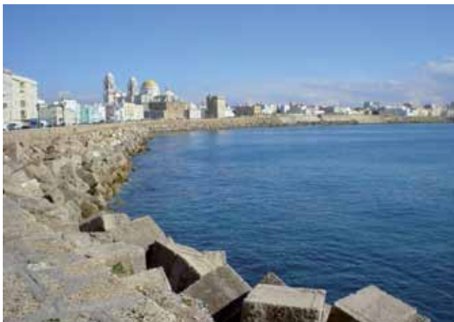
La bahía de Cádiz en la actualidad.