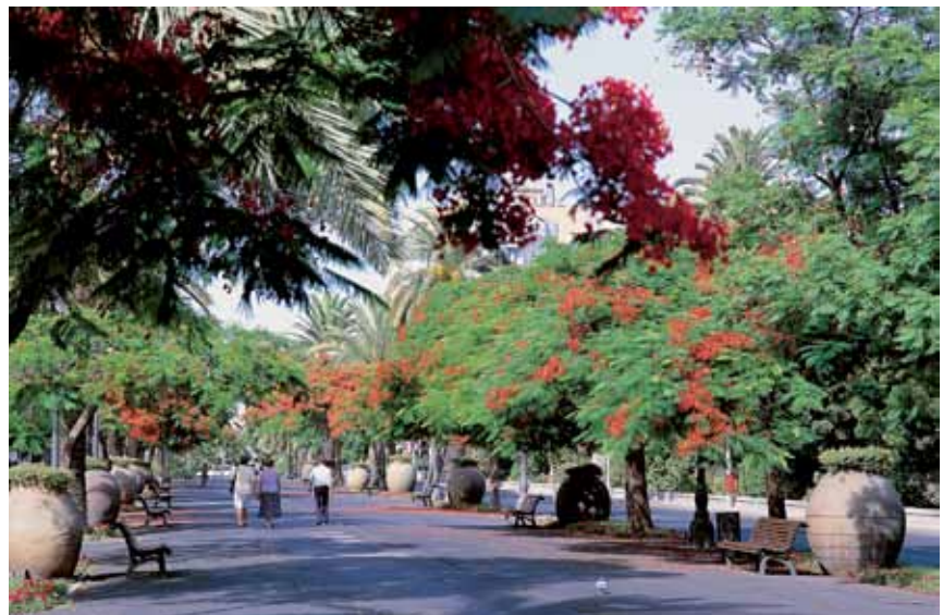
La escultura vanguardista se simultanea con espléndidos espacios verdes.