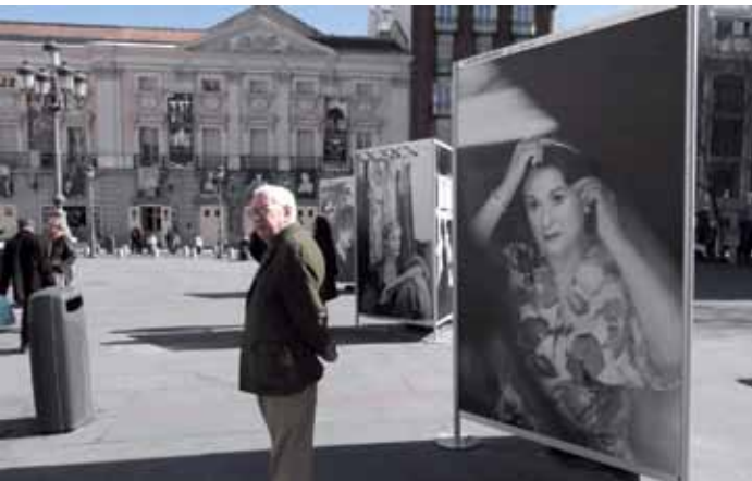
Dos actrices veteranas: a la izquierda Julieta Serrano y a la derecha Charo López.