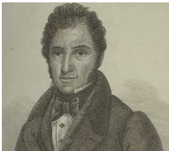
Agustín Argüelles, diputado en Cortes.