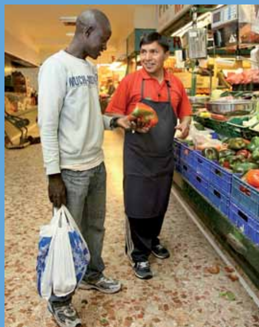
Hay tenderos de 17 nacionalidades entre los que destacan de Chile, Corea, Japón, India, Irán, Israel y Uruguay.