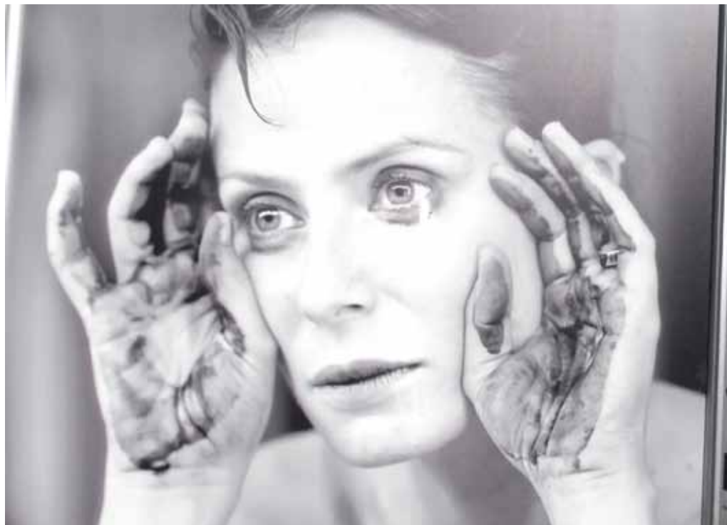
La actriz y empresaria Aitana Sánchez-Gijón