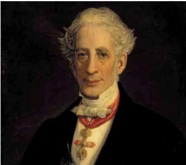
Francisco Martínez de la Rosa, diputado y el rey Fernando VII, que derogó la constitución en cuanto pudo.