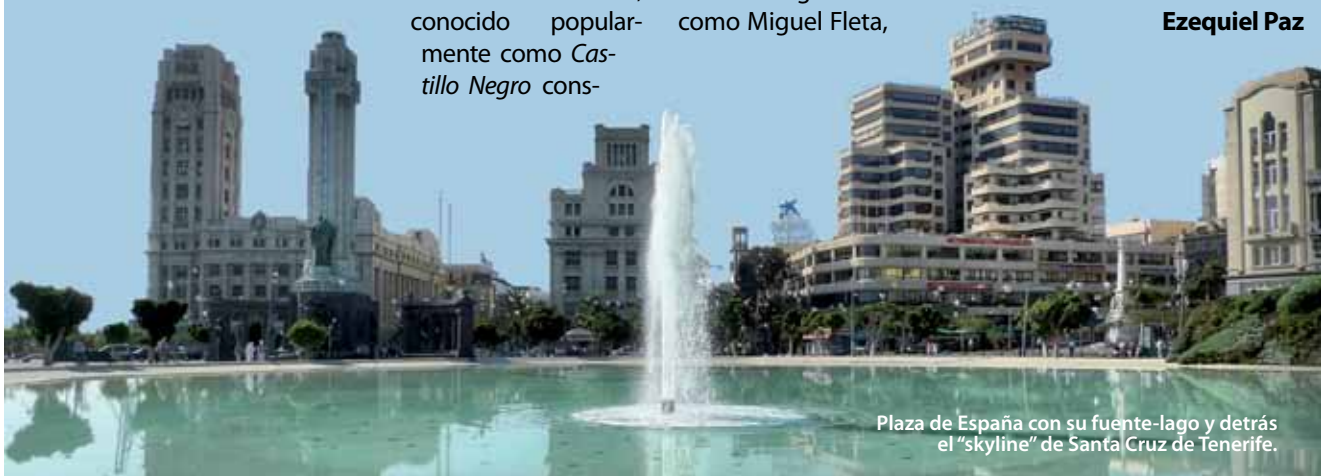
Plaza de España con su fuente-lago y detrás el "skyline" de Santa Cruz de Tenerife.