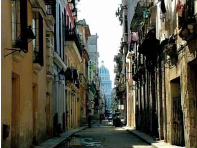
Imagen de La Habana Vieja.

más cada día a esa emigración que vivió fuera de su tierra, que añoró volver y no pudo y que hizo que sus hijos y nietos la quisieran siempre.