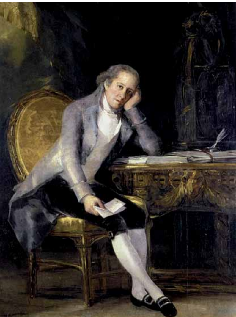
Gaspar Melchor de Jovellanos, ilustrado y precursor de la Constitución.