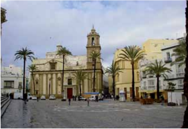
En el Cádiz actual quedan muchos vestigios de la Constitución.