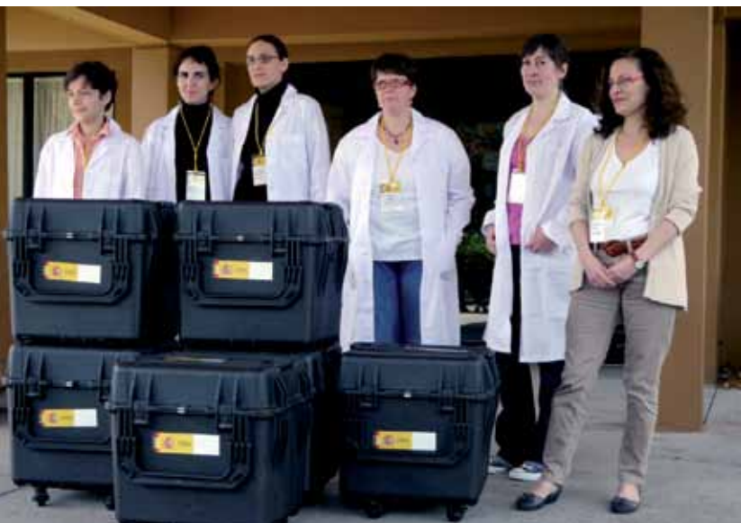
El gobierno español desplaza a Tampa (Florida) a un equipo de expertas en numismática, que estudiaron minuciosamente las monedas de la Nuestra Señora de las Mercedes