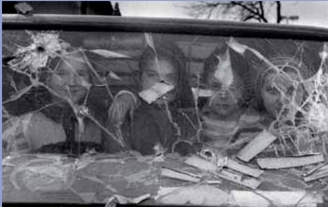
Niños víctimas de la Guerra de los Balcanes.