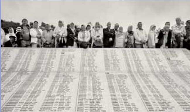
Las listas del genocidio en Bosnia.