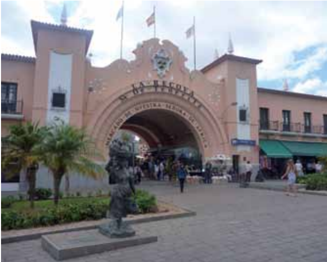
Santa Cruz de Tenerife combina la arquitectura tradicional con la más vanguardista