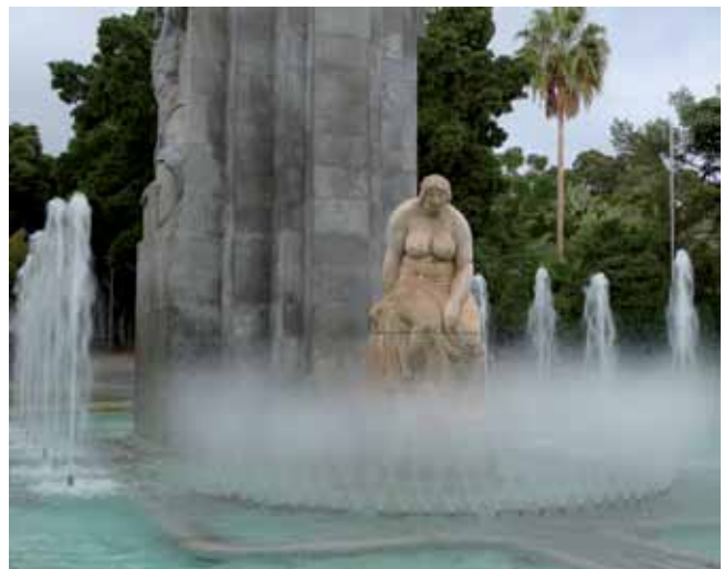
La ciudad ha conseguido una interesante simbiosis entre la naturaleza y la obra del hombre.