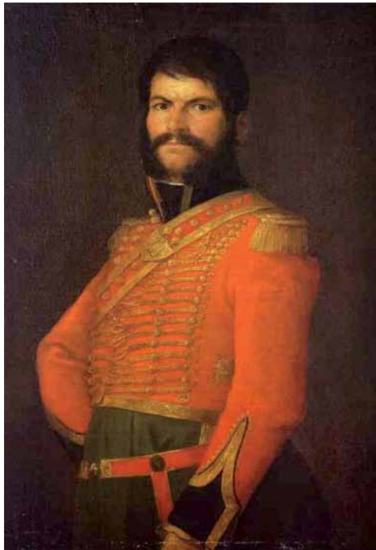
El brigadier Juan Martín “El Empecinado”.

drid y Burgos, en la Sierra de Gredos, en tierras de Ávila y Salamanca... fue una pesadilla para los franceses, que lograron acorralarlo en 1810 en Ciudad Rodrigo, aunque no capturarlo. Tras el regreso de Fernando VII, monarca que juró la Constitución de Cádiz, aunque después la derogó, Juan Martín fue acusado de liberal y desterrado a Valladolid.