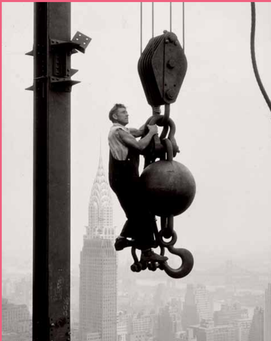
Obrero de la construcción en Nueva York.