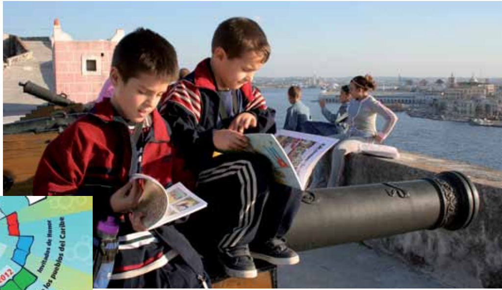
Niños leyendo en la Fortaleza de San Carlos de la Cabaña

Como telón de fondo, una exposición de carteles de las actividades culturales