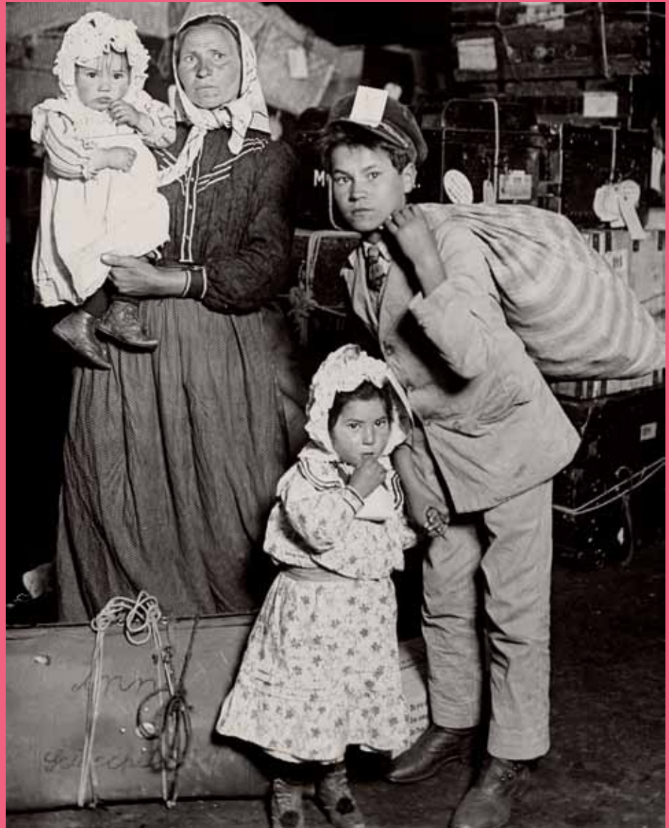
Familia italiana recién llegada a la isla de Ellis. 1905